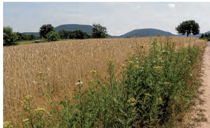
Üppiger Bestand des Rainfarns. Lebensraum der Wildbiene des Jahres 2022. R. Burger

Die Rainfarn-Maskenbiene fliegt von Ende Mai bis Ende August und besucht zum Pollensammeln ausschließlich Pflanzenarten aus der Familie der Korbblütler ( Asteraceae ). Bevorzugt wird der Rainfarn befliegen ( Tanacetum vulgare ), doch sammelt die Wildbiene des Jahres 2022 regelmäßig auch an anderen Korbblütlern, wie z. B. an der Färber-Kamille ( Anthemis tinctoria ), der Margerite ( Leucanthemum vulgare ) oder der Wiesen-Schafgarbe ( Achillea millefolium ). Weil die meisten Nahrungspflanzen der Rainfarn-Maskenbiene an sehr unterschiedlichen Standorten vorkommen und derzeit ungefährdet sind, besiedelt Hylaeus nigrinus verschiedene Lebensräume im Offenland und auch in unseren Siedlungen.