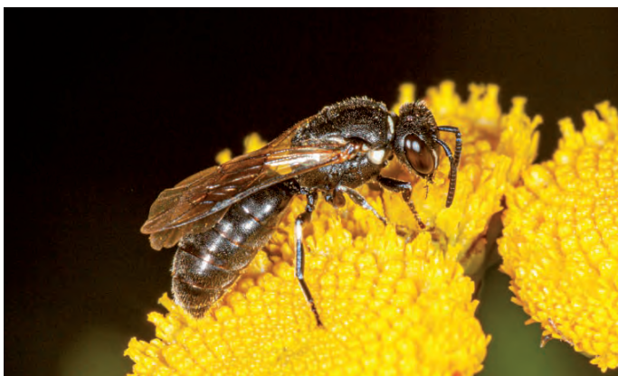
Die Rainfarn-Maskenbiene wirkt wie eine schwarze Wespe. Hier ein Weibchen auf Rainfarn. R. Prosi

In Deutschland leben 39 Arten von Maskenbienen ( Hylaeus ), die nur wenige Millimeter groß und einander sehr ähnlich sind. Die Tiere sind überwiegend schwarz gefärbt mit weißen oder gelben Partien an Brust, Beinen und Kopf. Die Männchen tragen oft auffällige Gesichtsmasken. Die Rainfarn-Maskenbiene ( Hylaeus nigrinus ) zählt mit bis zu neun Millimetern zu den großen Arten. Die elfenbeinweiße Gesichtsmaske der Männchen glänzt wie Emaille. Sie tragen zudem einen typischen, im Profil dreieckigen Höcker an der Bauchunterseite. Die Weibchen haben zwei dreieckige weiße Flecken zwischen Augen und Kopfschild. Wie allen Maskenbienen fehlen ihnen die bei anderen Bienen üblichen „Bürsten“ für den Pollentransport an Hinterbeinen oder Bauchunterseite.