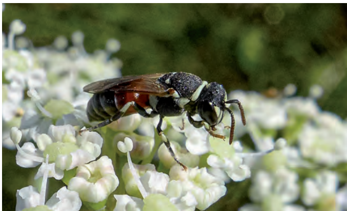
Ein Weibchen der Roten Maskenbiene mit den großen dreieckigen Gesichtsflecken und dem teilweise roten Hinterleib. M. Haider