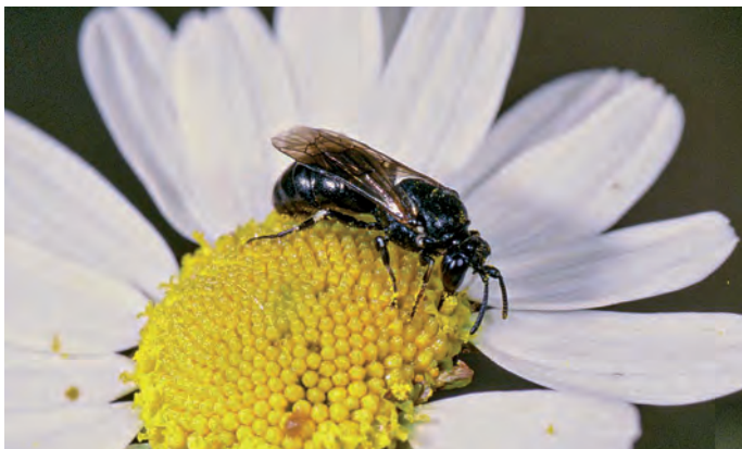
Beim Männchen von Hylaeus nigrinus ist die Gesichtsmaske glänzend elfenbeinweiß. R. Prosi